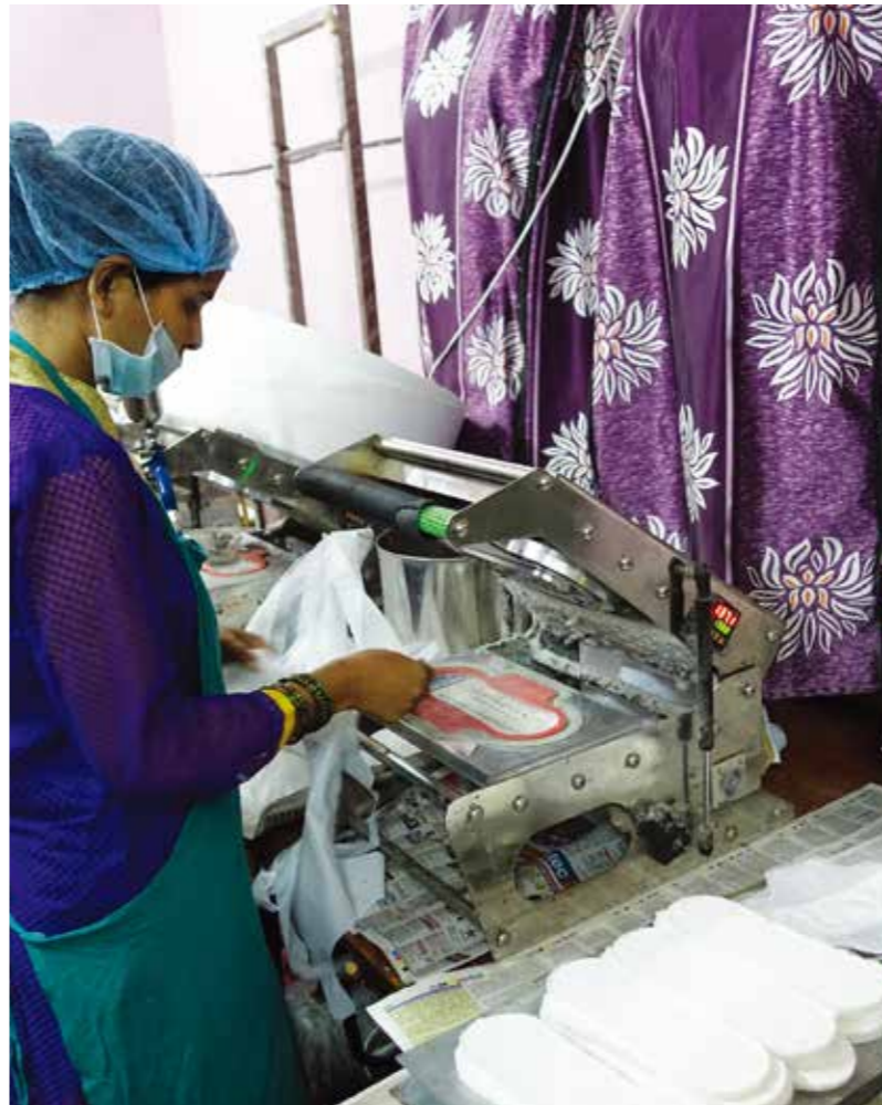
衛生巾製作項目不單能增加婦女收入，更有自主；亦可藉推廣使用衛生巾，減少婦女在經期時使用碎布而帶來的衛生問題

基督教在印度絕非主流宗教，基督徒人數只佔全國人口 3%，同樣是社會邊緣裏遭排擠和歧視的一羣，他們的服侍路一點也不易走。面對人手缺乏、資源緊絀，連辦公室也欠缺的情況，加上近來宗教自由越趨收緊，叫夥伴的服侍倍添困難。