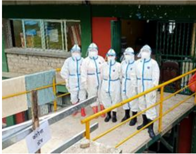
UMNMDT 所屬的醫院，醫護人員已經準備好，到隔離 病房工作。