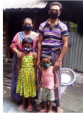
Vumi 一家成為見證，令鄰里更加認識和信任 WCB 的工作。