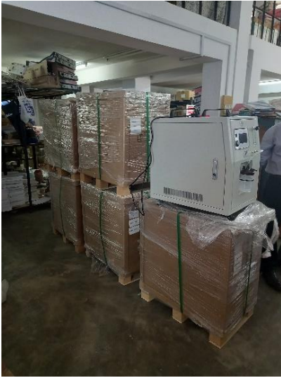
醫療物資送抵夥伴 LAMB 的醫院， 圖為製氧機。