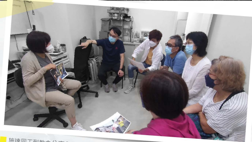
施達同工到教會分享SALT「鹽巴探訪模式」。