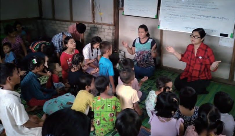
課堂上老師和學生一起祈禱。

識了一班朋友，一起學習。即使從未接受政府學校教育，但經過在學習點的上課，他已經可以閱讀和書寫，讀寫能力顯著提高。