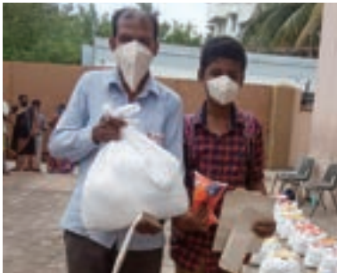
夥伴在疫情期間提供物資予有需要家庭。

施達與CMCT成為夥伴，回應印度貧困兒童及家庭的需要，為兒童支付學費，並提供上學所需的物品，如書包、校服、鞋子、書籍等；還提供洗漱用品、內衣和營養飲品；並於CMCT旗下的醫院，提供年度體檢和健康支援，滿足兒童的健康需要；而每月的活動日以及暑假的信仰探索聚會，也提供反思生命的機會，提升他們社交能力，促進全人發展。