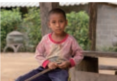
泰緬邊境少數族裔兒童。

缺乏教育支援為少數族裔兒童帶來極大挑戰。很多少數族裔孩子由出生至入學前，身邊所有人都只說母語，直至上學才接觸官方語言。聽不懂老師授課，跟不上學習進度，繼而失去學習動機、成績欠佳，加上家境貧困，輟學打工幫補家計是更合理的選擇。可是，識字不多又沒有職業技能的青少年如何謀生？靠親友介紹到城市工作似乎是一條好出路，可惜，一旦所託非人，孩子們往往落入被販賣、強逼勞役、從事危險工作、受侵犯的困境，甚至是遭強迫拍下猥褻影像而在互聯網販售，身心飽受創傷。