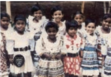
項目初期的受助兒童。

夥伴表示，面對失業帶來的失意，許多家庭的父親酗酒成癮，對家庭不聞不問，將其他家庭成員賺取得的微薄收入，取去購買酒和毒品；家庭面對經濟壓力，要向鄰居借貸度日；家庭無法送孩子上學，孩子欠缺教育機會，淪為童工，或成為邊緣少年。