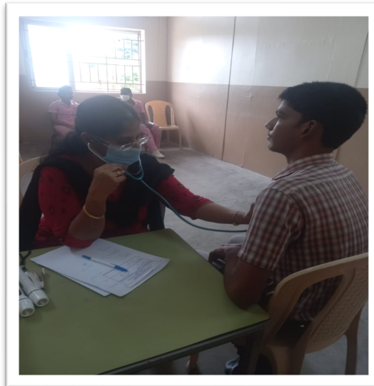
為受助孩子提供每年醫療檢查