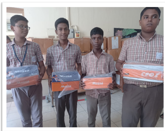
為受助孩子提供鞋、校服和書包等上學所需物資